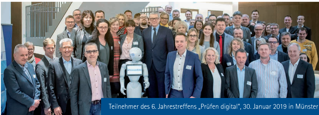
Teilnehmer des 6. Jahrestreffens „Prüfen digital“, 30. Januar 2019 in Münster

Am 30. Januar 2019 fand in Münster das sechste Jahrestreffen „Prüfen digital“ statt. Über 70 Prüfungsverantwortliche von über 40 IHKs diskutierten die aktuellen Entwicklungen, die die IT-gestützte Organisation, Durchführung, Korrektur und Nachbereitung schriftlicher Prüfungen in den nächsten Jahren prägen werden. Mit Blick auf die Prüfer wurden wichtige Impulse erarbeitet, um das Ehrenamt von Verwaltungsarbeiten zu entlasten und den Kern der Aufgabe, die qualitative Bewertung von Prüfungsleistungen, neu zu fokussieren.