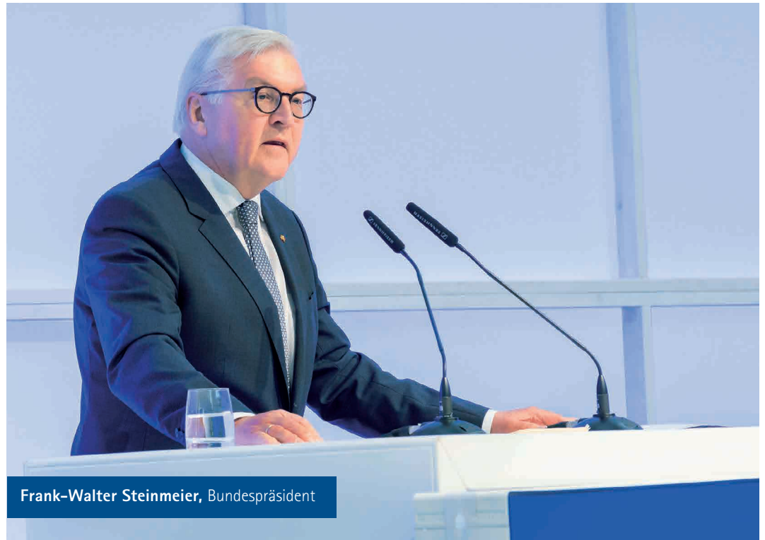
Frank-Walter Steinmeier, Bundespräsident

Deswegen wollten meine Frau und ich diese Woche zeigen, was wir der beruflichen Bildung in Deutschland verdanken. Wir wollten darauf aufmerksam machen, dass wir uns um sie kümmern müssen, um sie attraktiv und zukunftsfest zu machen. Und wir wollen, dass die