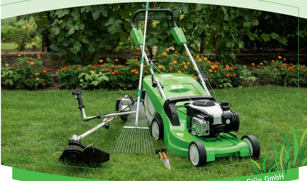
Gartengeräte Grün GmbH

Die Hauptkunden der Gartengeräte Grün GmbH sind die Nord Gartengroßhandels KG, die Garten & Geräte GmbH und der Baumarkt Poll. Es gibt keinen Direktverkauf an Endkunden.